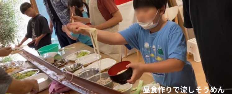
昼食作りで流しそうめん