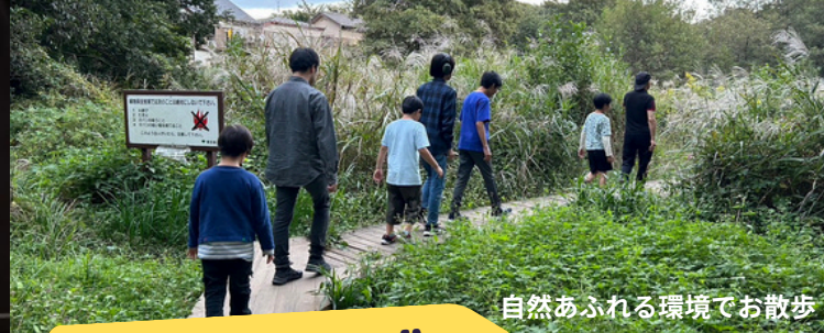
自然あふれる環境でお散歩