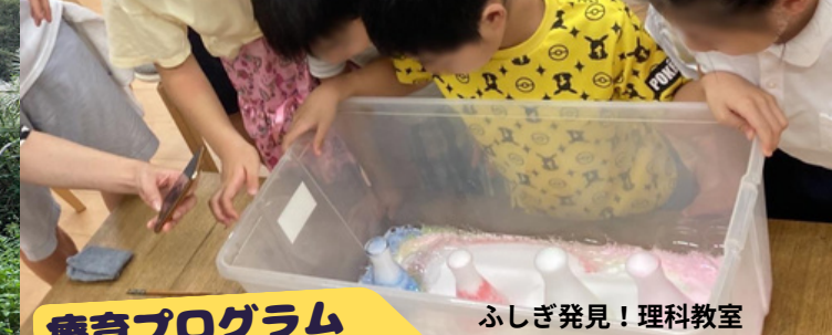
ふしぎ発見！理科教室